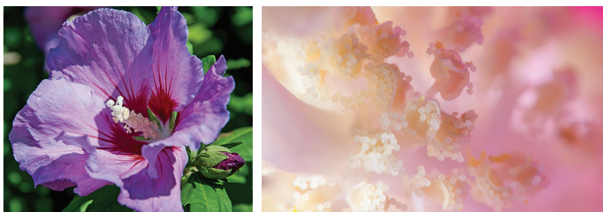
Figura 1 L'immagine a sinistra ritrae un fiore di alcea, quella a destra l'interno del fiore, dove si notano le antere schiuse presenti sugli stami con la fuoriuscita del polline, il cui diametro medio è di circa 60 \mu\text{m} . La fotografia a destra, che è stata acquisita con una fotocamera professionale corredata da un'ottica customizzata con diaframma f/45 e luce flash, è opera di Massimiliano Benvenuti, che ringraziamo per la cortese autorizzazione alla pubblicazione.

L'immagine (Figura 1) illustra la necessità di studiare il “molto piccolo” nel quadro della visione dell'intero. L'esame dei dettagli microscopici ci fornisce un livello di conoscenza della realtà essenziale per il progresso scientifico, ma non ne costituisce il livello ultimo e veritiero. Se vedo solo l'immagine di destra, perdo la visione del fiore; così, se vedo solo la colesterolemia, perdo quella del paziente. Dobbiamo certamente conoscere l'organizzazione molecolare del fiore e del paziente, ma dobbiamo valutare quei dati non come determinanti semplici e univoci, che spiegano la complessità dell'organismo vegetale o animale. Dobbiamo invece leggerli nel quadro dell'intero. Del resto, è questa la critica al riduzionismo che, 40 anni or sono, presentò George Engel: nessuna obiezione allo studio sempre più preciso dell'organizzazione molecolare e particellare della vita, che è il motore della ricerca scientifica, bensì critica radicale alla pretesa di ridurre a determinanti semplici la spiegazione di fenomeni complessi come la salute e la malattia.